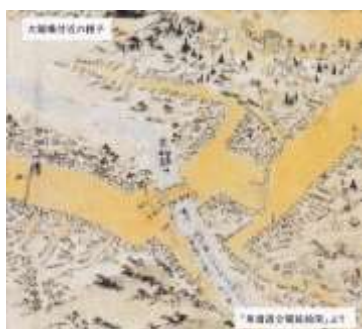
東海道分間延絵図

江戸時代の東海道分間延絵図を頼りに藤沢宿を巡り、古文書、絵図、浮世絵等の資料を繙き宿場の街並み、風情、魅力を垣間見る。