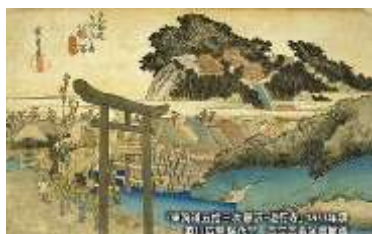
東海道五十三次之内 藤沢